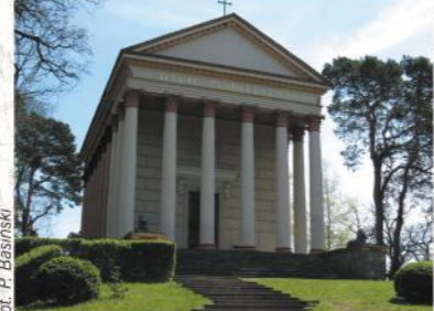
Kościół pw. św. Marcelina w Rogalinie

Pierwsza wzmianka o Rogalinie pochodzi z 1247 r. Wtedy to Przemysł I potwierdził dokument kanonika poznańskiego Mikołaja, który nadał Rogalin kościołowi katedralnemu w Poznaniu. Majątek ziemski o tej samej nazwie założony został po 1294 roku. Należał najpierw do rodu Łodziów z Bnina, następnie był własnością kilku rodów, aż w roku 1768 trafił ostatecznie do rodziny Raczyńskich.