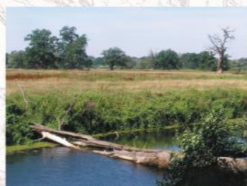
Krajobraz doliny Warty pod Rogalinem

Rogalin to wieś położona na prawym wysokim brzegu rzeki Warty, przy szosie Mosina - Kórnik, na terenie Rogalińskiego Parku Krajobrazowego, utworzonego 26 czerwca 1997 r. w celu ochrony jednego z największych w Europie skupisk dębów szypułkowych oraz unikatowej rzeźby terenu, na którą składają się liczne starorzecza występujące na terenie zalewowej i nadzalewowej. Ponadto Rogalin znajduje się na terenie dwóch obszarów Natura 2000: Obszaru Specjalnej Ochrony Ptaków Ostoja Rogalińska (PLB300017) oraz Obszaru mającego znaczenie dla Wspólnoty (projektowanego specjalnego obszaru ochrony siedlisk) Rogalińska Dolina Warty (PLH300012).