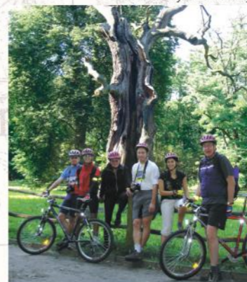
Rowerowy Szlak Warty

Stacje benzynowe: Mosina, Świątynki (przy trasie z Kórnika)