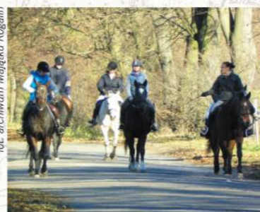
Na konnym szlaku