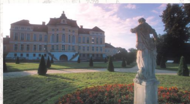
Zespół pałacowo-parkowy w Rogalinie

Od tego momentu miejsce to stało się coraz bardziej znane. Tuż po zakupie Rogalina, Kazimierz Raczyński rozpoczął budowę okazałej rezydencji. Dzięki zamianowaniu Raczyńskich do sztuki i literatury zgromadzone w pałacu bogatą kolekcję malarstwa i literatury.